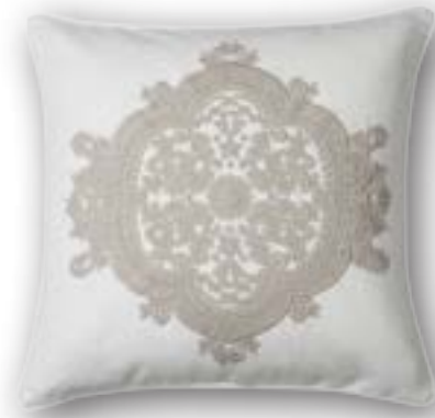
Cushion Franzi 110 · 50×50 cm 53% CO | 47% LI