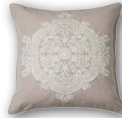
Cushion Franzi 111 · 50×50 cm 53% CO | 47% LI