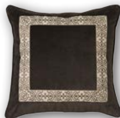
Cushion Zita 140 · 50×50 cm 100% CO