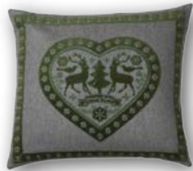
Cushion Hirschlein 130 · 50×45 cm 42% WO | 35% PES | 20% PAN | 3% PA