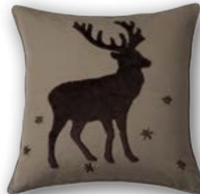
Cushion Platzhirsch 140 · 50×50 cm 53% CO | 47% LI