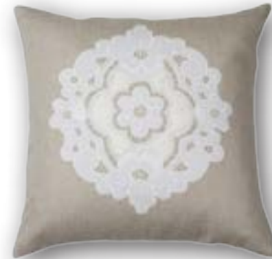
Cushion Josefa 110 · 50×50 cm 100% LI