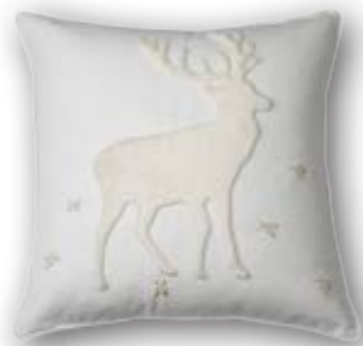
Cushion Platzhirsch 110 · 50×50 cm 53% CO | 47% LI