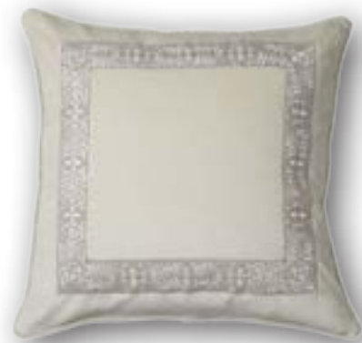
Cushion Zita 110 · 50×50 cm 100% CO