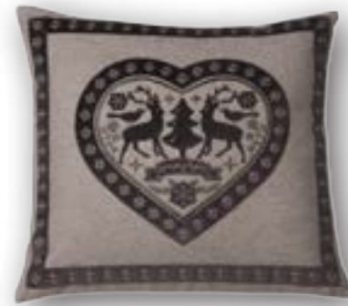
Cushion Hirschlein 140 · 50×45 cm 42% WO | 35% PES | 20% PAN | 3% PA