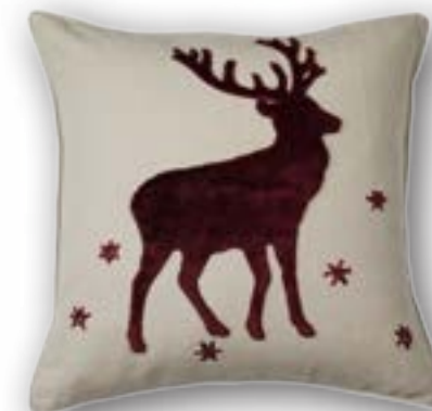
Cushion Platzhirsch 150 · 50×50 cm 53% CO | 47% LI