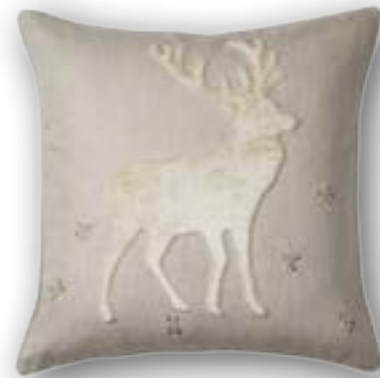
Cushion Platzhirsch 111 · 50×50 cm 53% CO | 47% LI