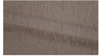
Be Fine 040