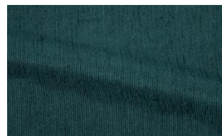
Be Fine 030