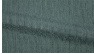
Be Fine 031