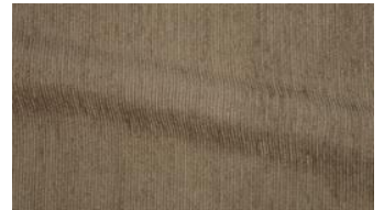
Be Fine 043