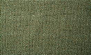
Feel Me 080