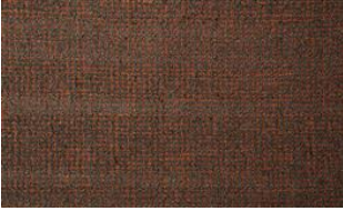
Feel Me 070