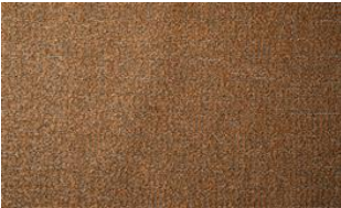
Feel Me 060