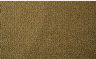
Feel Me 020