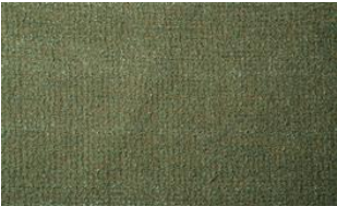
Feel Me 080