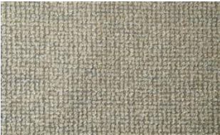
Feel Me 010