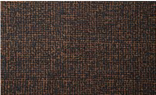
Feel Me 081