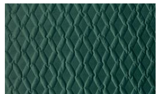
Luca Rhomb 032