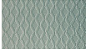
Luca Rhomb 080