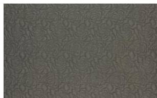
Maxi Fleur 070