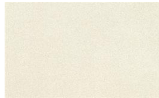
Milky Way o10