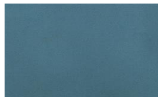
Milky Way o81