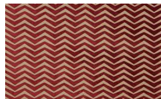
Zig Zag 050