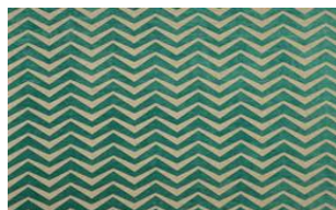
Zig Zag 080