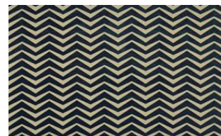
Zig Zag 081