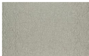
Maxi Fleur 080