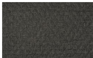
Samy Rhomb 070