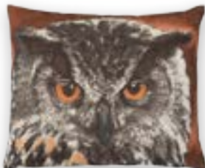
See you 169 · 52×43 cm Vorderseite | Front: 50% CO | 50% PES Rückseite | Reverse: 100% PES

Kissen ohne Füllung. Die Abbildungen sind nicht farbverbindlich. | Cushions without filling. The colours of the illustrations may vary.