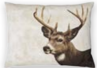
King of Forest 119 · 60×45 cm Vorderseite | Front: 50% CO | 50% PES Rückseite | Reverse: 100% PES