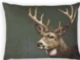
King of Forest 139 · 57×43 cm Vorderseite | Front: 50% CO | 50% PES Rückseite | Reverse: 100% PES