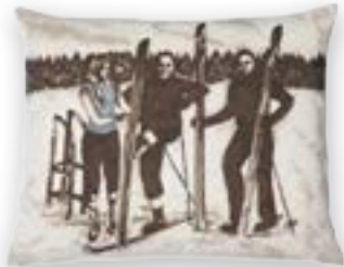
Bormio 149 · 55×45 cm Vorderseite | Front: 56% PES | 44% CO Rückseite | Reverse: 100% PES