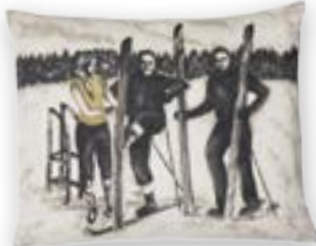
Bormio 179 · 55×45 cm Vorderseite | Front: 56% PES | 44% CO Rückseite | Reverse: 100% PES